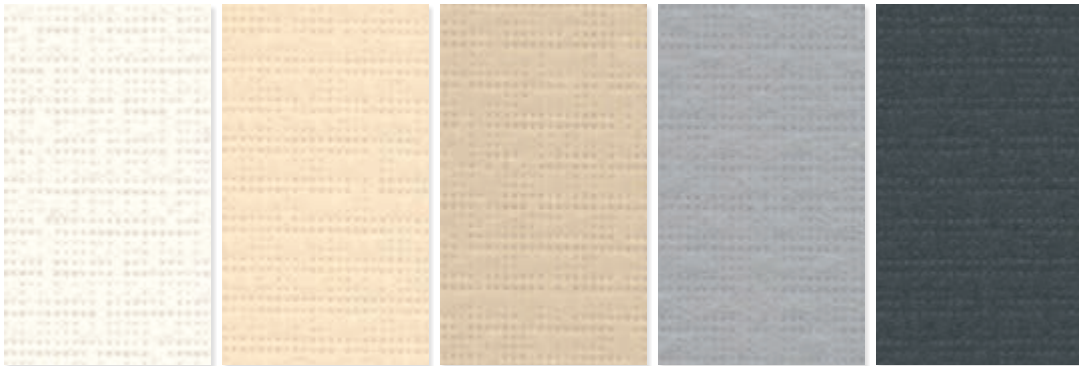
PE 90W (Weiß) PE 100W (Creme) PE 110W (Beige) PE 120W (Grau) PE 130W (Anthrazit)