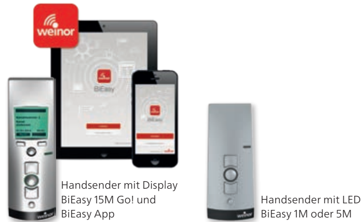
Handsender mit Display BiEasy 15M Go! und BiEasy App

Mit den Infrarot-Heizungen Tempura und Tempura Quadra können Sie Ihre Terrasse abends länger nutzen – auch in kühleren Jahreszeiten. Sie bringen angenehme Sofortwärme ganz ohne Vorheizen. Tempura und Tempura Quadra sind dimmbar, energieeffizient und leicht zu bedienen.